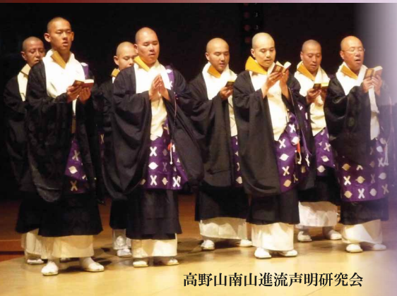
高野山南山進流声明研究会

+++ 第6回 ●●● SWISS WEEK Switzerland meets Japan in concert 2014