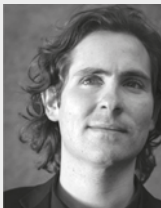
DINO LÜTHY テノール