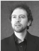
DORON SCHLEIFER カウンターテノール