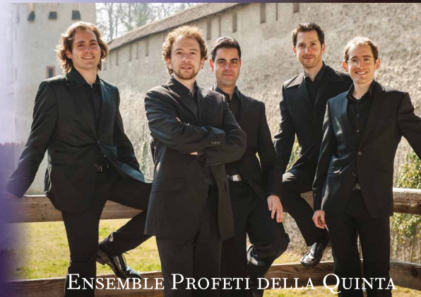
ENSEMBLE PROFETI DELLA QUINTA

+++ 第6回 ●●● SWISS WEEK Switzerland meets Japan in concert 2014